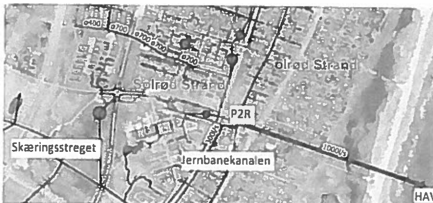
Figur 1 Oversigt

Oplandet i Jersie Strand leder i dag regnvand til regnvandspumpestationen (P2R) ved Parkvej, som i dag pumper det ud i Jernbanekanalen. Kanalen løber mod syd og ud i Skæringsstregtet og Skensved Å, som har sit udløb i Lagunen ved Køge Bugt. Se oversigtsfigur nedenfor.