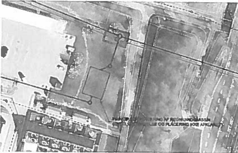
Figur 2 - Placering af regnvandskassetter

KLAR Forsyning Vasebækvej 40 4600 Køge Telefon 56 65 22 22 klar@klarforsyning.dk